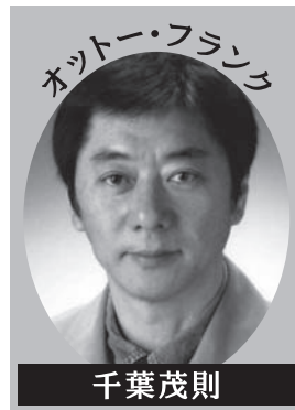
オットー・フランク 千葉茂則