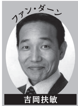
ファン・ダーン 吉岡扶敏

【ものがたり】 1942年夏。オランダに住むアンネ一家は、アムステルダムのとある屋根裏部屋に隠れました。街ではナチスのユダヤ人狩りが猛威をふるっています。昼間は声も立てられず、水も使えず、深刻な食料不足。そんな中でも明るくのびのびと振る舞うアンネは、しばしば母や同居人たちと衝突します。でも少年ペーターとだけは心が通いあい、ほのかな愛情が芽生えます。絶望の淵に連合軍が上陸したというニュース！ 解放の日に近い。だが、2年目の夏の午後、階下で不気味な電話が鳴り続けるのでした……。