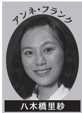
アンネ・フランク 八木橋里紗