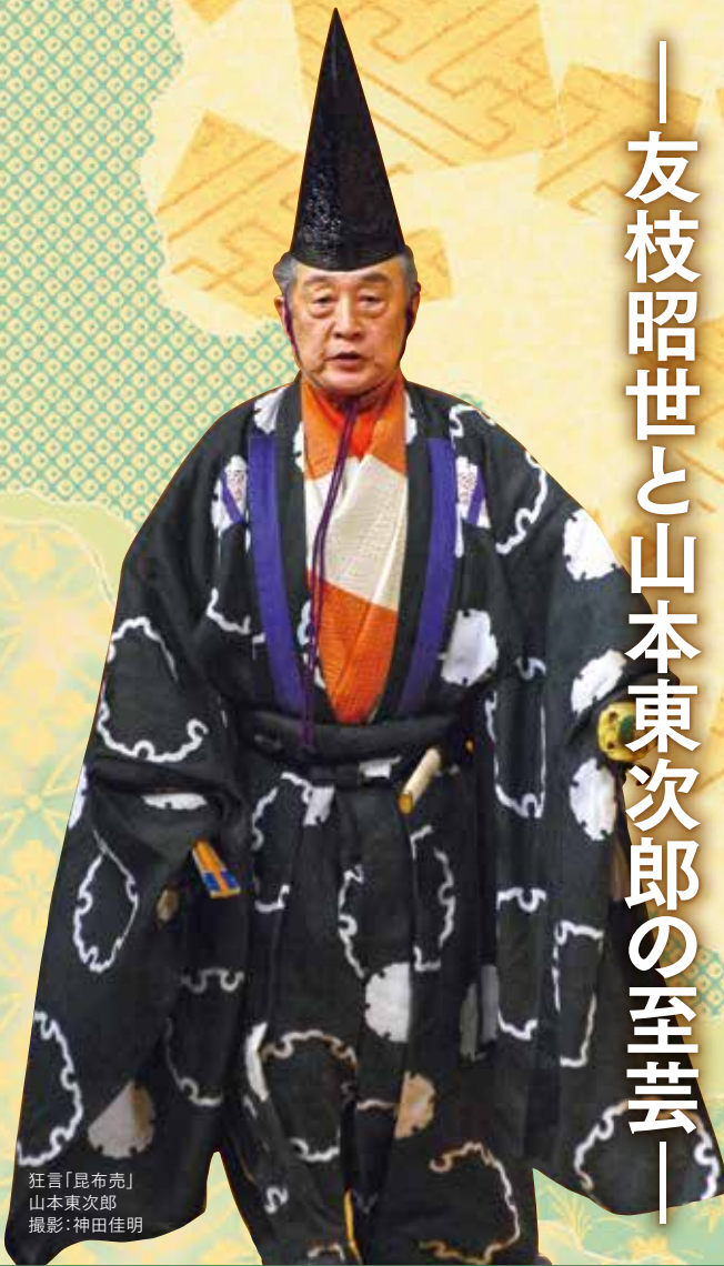
狂言「昆布売」 山本東次郎