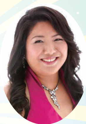
ソプラノ・リリコ