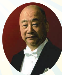
ナビゲーター/バリトン

料金 全席指定 3,800円 2月1日発売開始 U25 (25才以下) 2,000円