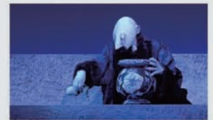
2007年 劇場・シアターX 「the bicycle」