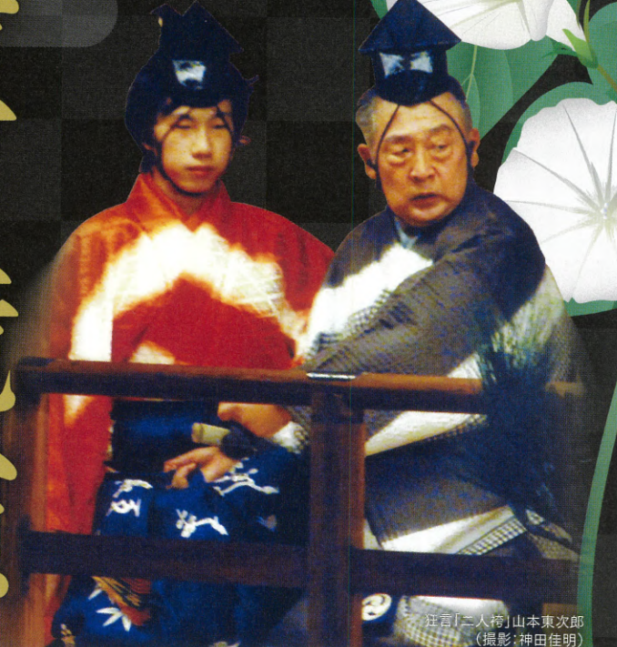
狂言「二人袴」山本東次郎

■チケット発売 ①先行発売(インターネットのみ) 1月17日(金)10:00~1月24日(金)23:59 ※会員登録(無料)が必要です ②一般発売 1月31日(金)9:00より一斉発売