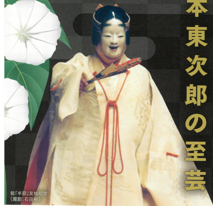
能「半部」友枝昭世